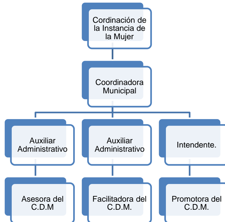
Figura 4. Estructura Orgánica de la Instancia de la Mujer del Municipio de Lázaro Cárdenas.