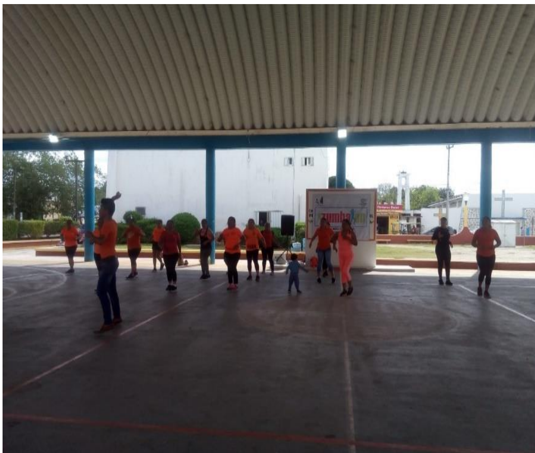
Imagen 6. Evidencia de la impartición de actividad física.