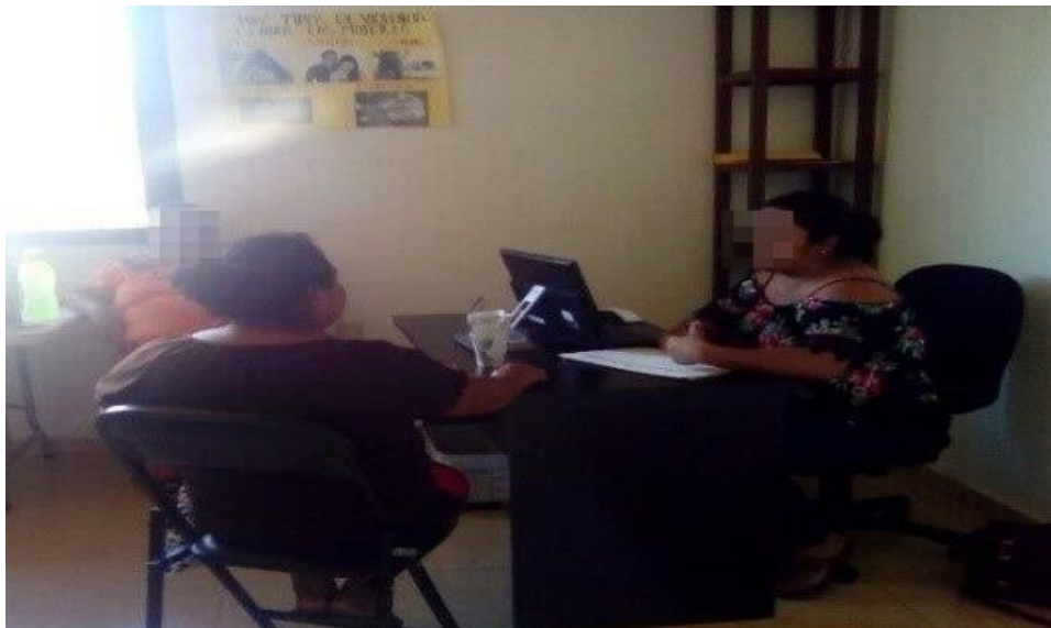
Imagen 8. Evidencia del otorgamiento de un servicio.