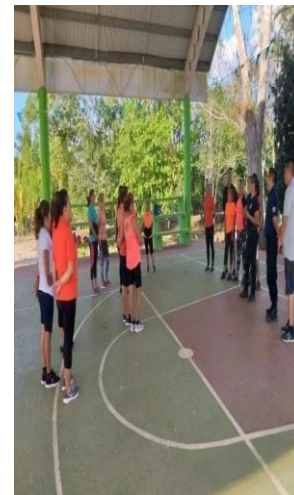
Clases de zumba

Fuente: Elaborado por la ASEQROO con información proporcionada por el H. Ayuntamiento del Municipio de Lázaro Cárdenas.