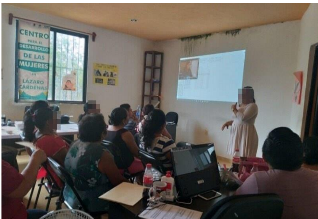
Imagen 5. Evidencia de la impartición de pláticas.