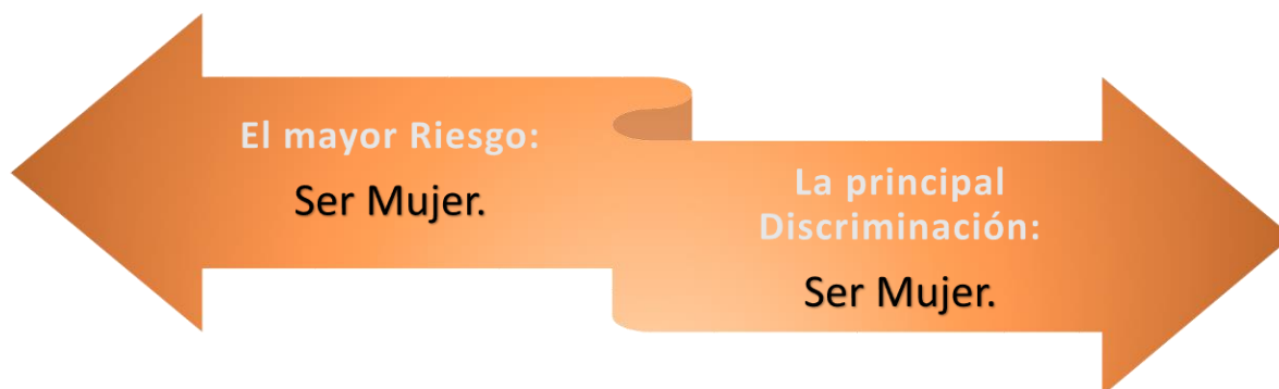
Figura 1. Situación que enfrentan las mujeres

Fuente: Elaborado por la Aseqroo con información del Programa Estatal para Prevenir, Atender, Sancionar y Erradicar la Violencia contra las Mujeres de Quintana Roo.