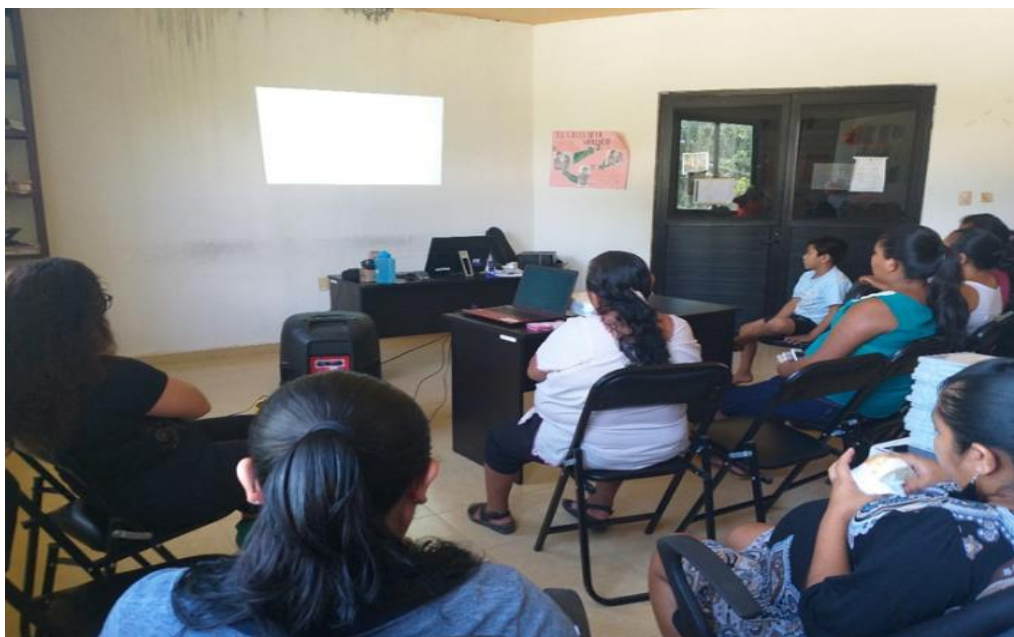
Imagen 7. Evidencia de la impartición de plática.