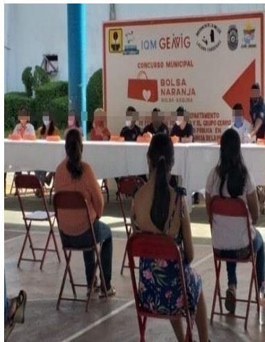
Concurso Municipal de bolsa naranja (bolsa segura)

Imágenes 1, 2 y 3. Evidencia fotográfica de los eventos realizados por el GEAVIG en coordinación con otras instancias públicas.