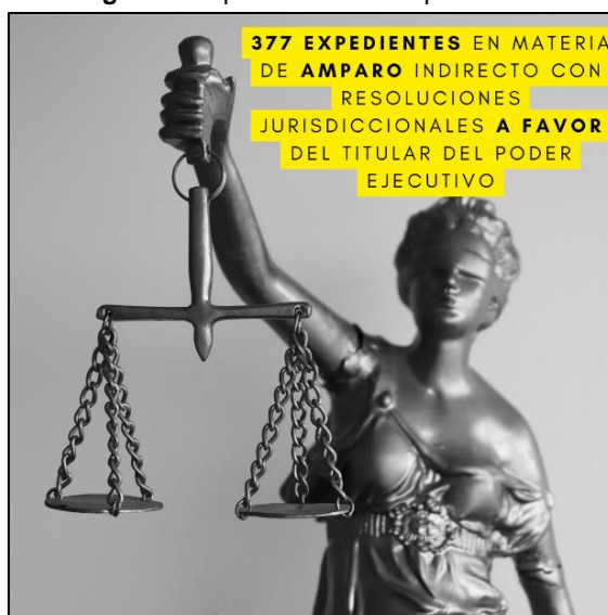
Imagen 4. Amparos tramitados por la CJPE.