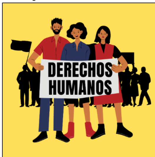
Imagen 5. Atención de la fracción XIX.