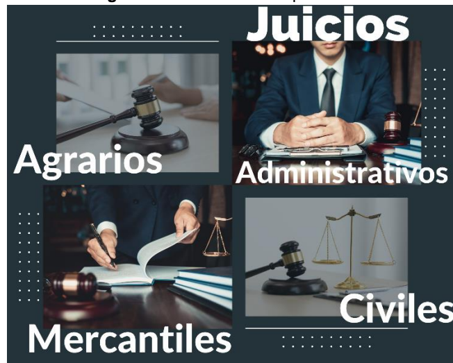
Imagen 3. Juicios atendidos por la CJPE.