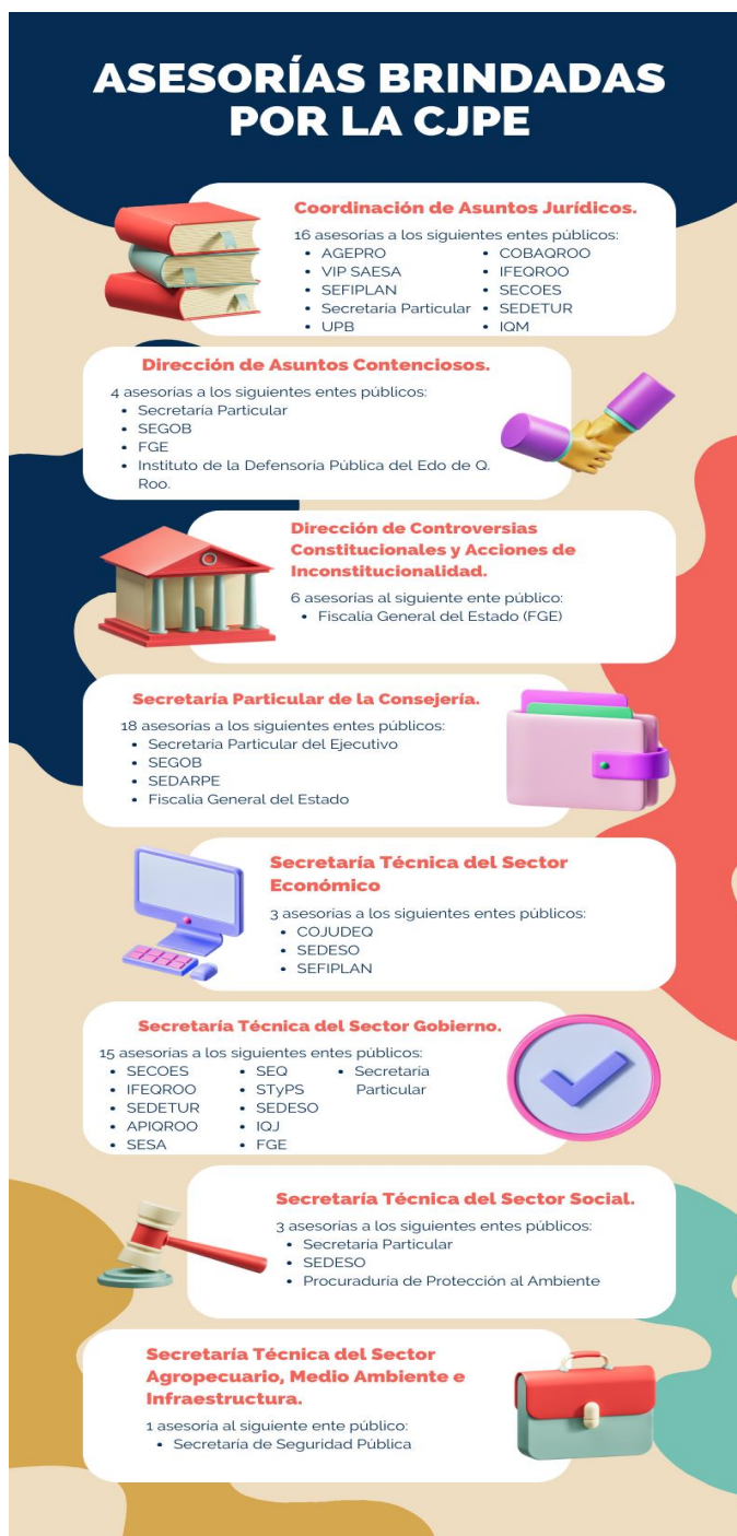
Imagen 1. Asesorías brindadas por la CJPE.